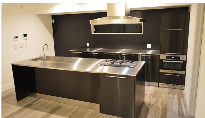
BLACK96が 採用された オーダーメイドキッチン

2020年に発売した黒色ステンレス「BLACK96」も活躍の場を広げ、厨房機器大手のタニコー殿はオーダーメイドキッチンにBLACK96を使用した高級感のあるキッチンを多数施工しています。引き出し部分やアイランドキッチンの側面などに用いることで、濃い黒と大理石や木材が調和し、そのデザイン性の高さが人気を得ています。