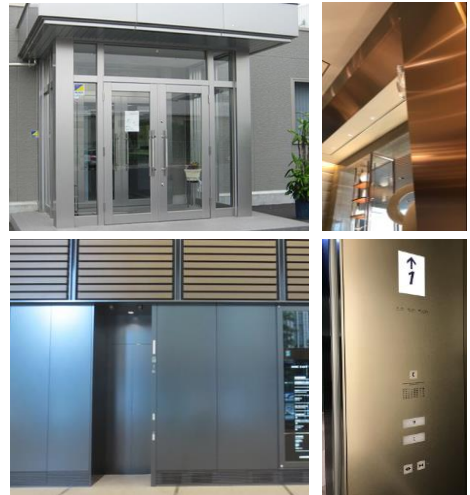
エントランス、内装、エレベーター